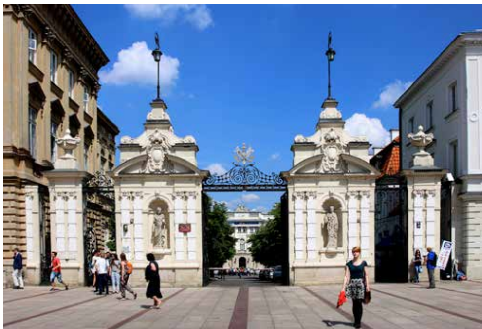
Brama Uniwersytetu Warszawskiego